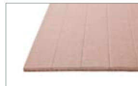
Wellkartonplatte einseitig geritzt