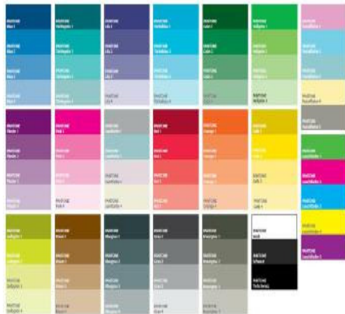
... individuell bedruckbar, Farbenvielfalt