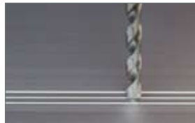
Bohrung Nr. 1 einbringen