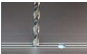
Bohrung Nr. 2 einbringen